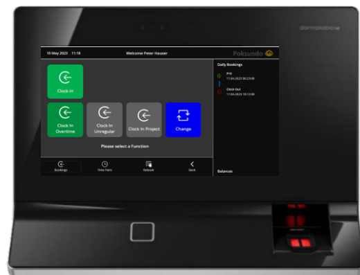
Illustration : Terminal de saisie des temps dormakaba 9700 avec dialogue utilisateur individuel